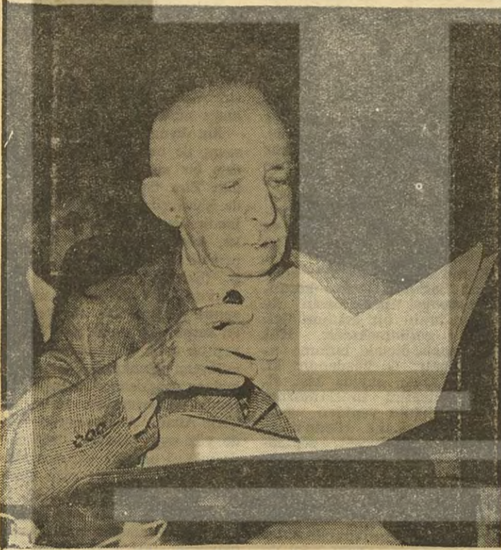
CHP Genel Başkanı İsmet İnönü

Bununla beraber, bir takım hevesler besleyenler, bir şeyler