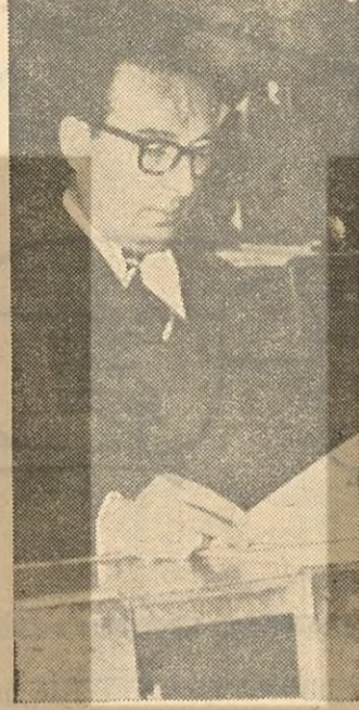
Prof. Turhan Feyzioğlu Nereden nereye!...

Feyzioğlu'nun çırpınışları, Türkiye'nin Filipin tipi bir demokrasi olup olacağını tayin bakımından, parti içi bir çekismeyi kat kat aşan bir önem taşımaktadır. Demirel dahi, Türkiye'de bugün parti farklarının ötesinde iki cephenin «yaşama savaşı» verdiğini açıklamıştır. Bu iki cephe, emperyalizm ve işbirlikçilerinin cephesi ile demokratik milliyetçilerin cephesidir. Feyzioğlu ekibi, bu «yaşama savaşı»nda, Demirel'in safında yer almıştır. Yabancı petrol şirketleriyle yakın ilgisi bilinen bir dergi bu durumu kendi açısından büyük bir isabetle belirtmektedir: «Aşırı sola karşı olanlar şimdi CHP'nin bünyesinde, koskoca bir ortak gruba müttefik olarak sahıptirler. Bu ise iç politikamızın hayrına çok önemli bir