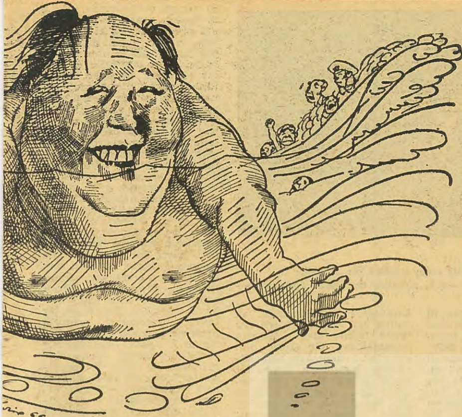
VID LEVINE'NİN GÖZÜYLE MAO Kültür İhtilâlini başlatmadan önce nehirde 15 kilometre yüzdü.

adılar. Yazarlara göre, üretim güçlerinin çok az gelişmiş bulunduğu bir ülkede, sosyalist mülkiyet ilişkilerine ve günümüzün ileri üretim biçimlerine geçilmesi, mülkiyet ilişkileri ve üretim biçimleri ile üretim güçleri arasında özgül (spesifik) çelişmelere yol açmaktadır. Çelişmelerin özgül karakteri, günümüzün modern üretim biçimleriyle, sosyalist mülkiyet ilişkilerinin, üretim güçlerinin gelişmesine nazaran çok «ileride» bulunmasından doğmaktadır. Eğer bu özgül çelişmelere hükmedilebilirse, hızlı bir kalkınma yolu açılacaktır. Önemli olan bu çelişmelerin varlığı değil, çelişmelere hükmedilmesidir. Bu bakımdan, eğitim ve ideoloji yoluyla sosyal «bilinç»in geliştirilmesi, uygun değer ve eylem sistemlerinin yaratılması büyük önem taşımaktadır. Bu yüzden, Çin sosyalizminin özelliğini, eğitime, organizasyona ve ideolojiye verilen önem teşkil etmektedir. Yeni insanın yaratılması, sosyalizmin insanın nihai amacı olduğu kadar, inşa halindeki toplumun etkin biçimde işleyişinin şartı olmaktadır.