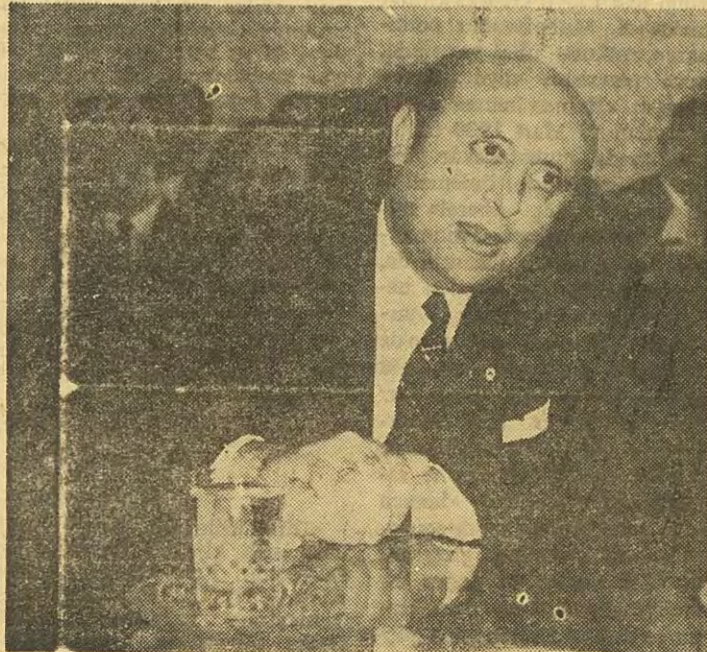
Başbakan Süleyman Demirel

Vatanî ve kanunî görev» sözlerinin altında nelerin gizlendiğini, aynı gün, Nadir Nâdi, saygılı üslûbuyla apaçık belirtiyordu: «27 Mayıs Devrimini candan benimseyen, benimsediğine dair imzası altında yazı yayınlayan, Anayasa düzeni içinde Türk Ordusunun en yüksek ve en sorumlu yerinde görev alan, demokrasiye inanmış, Atatürkçü bir general, bir faşist kabadayısı gibi sokak ortasından adam kaçırıp dövdüremez, hukuk düzenine karşı bir takım tertiplere girişemez, kişisel hırslara kapılamaz, asil görevinin kendine yüklediği ağır sorunu unutarak, milleti karanlık serüvenlere sürüklemeyi düşünemezdi». Prof. Bahri